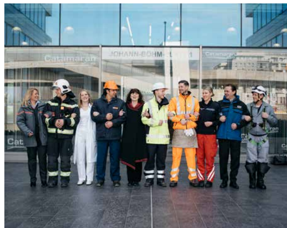
Im Herbst braucht es gute Lohnerhöhungen. Die ArbeitnehmerInnen haben es sich verdient

Klar ist: Dafür muss es auch eine deutliche finanzielle Anerkennung geben: „Wir brauchen gute Lohnerhöhungen und gute Lohnverhandlungen im kommenden Herbst. Die Arbeitnehmerinnen und Arbeitnehmer, die in diesen Zeiten dafür sorgen, dass die Versorgung der Bürgerinnen und Bürger aufrecht bleibt, haben es verdient.“ ■